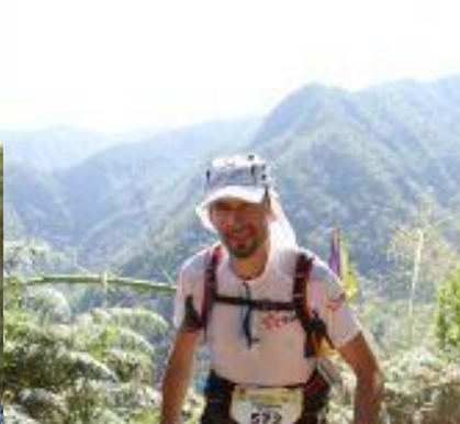
La vue en haut du Maïdo !! Vraiment magnifique