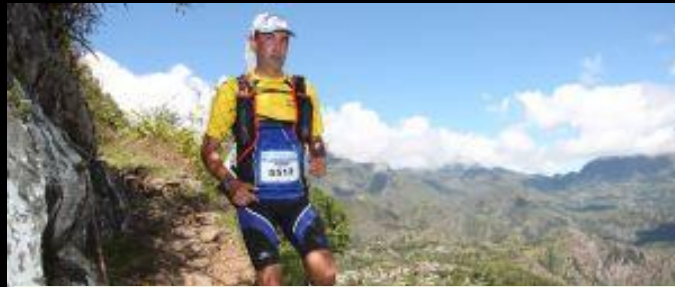
La vue sur Mafate depuis le sentier scout L'encouragement par les coureurs réunionnais se reposant sur le coté