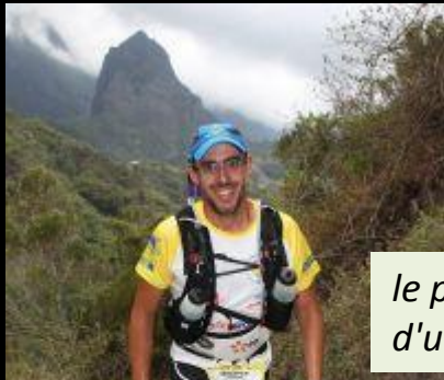
le piton des neiges émergeant d'un halot de nuage