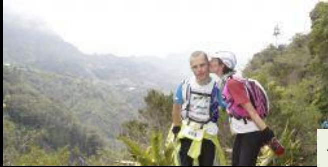
Levée de soleil sur Mafat vu du Maïdo